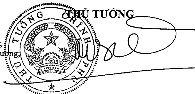
Phạm Minh Chính